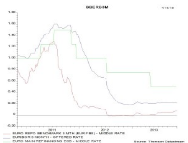
Grafiek 1 : Officiële korte termijntarieven in Europa

Maar een dergelijke evolutie dreigt ook de interbancaire rentetarieven naar boven te doen evolueren en dat staat haaks op de gewenste beweging. De ECB probeert immers deze tarieven die Europese banken aan mekaar aanrekenen zo laag mogelijk te drijven. Zo vormen interbancaire leningen immers geen alternatief voor kredieten aan bedrijven en kan de